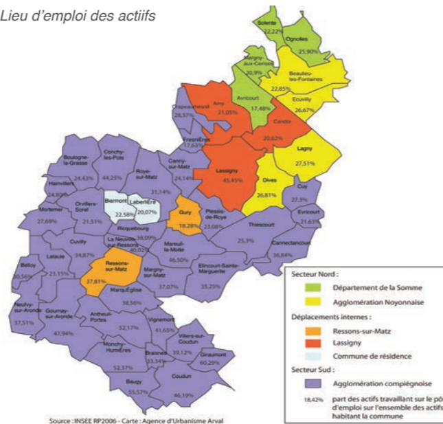
Lieu d'emploi des actifs