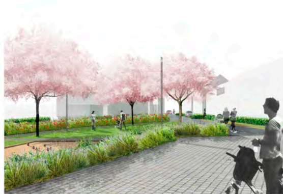
2. VUE DEPUIS LA PLACETTE DES OULCHES SUR LE BOULODROME, LE JARDIN ET LA VOIE PARGAGÉE