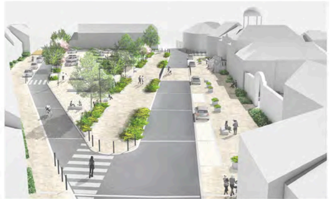
1. PERSPECTIVE AXONOMÉTRIQUE DEPUIS N°17 ET 18