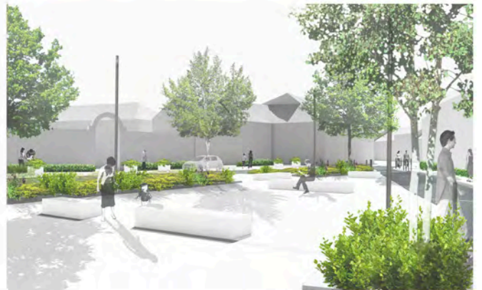
2. ESPACE DE DÉTENTE AU DROIT DE LA MAISON DE RETRAITE