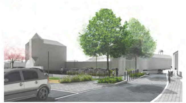
1. VUE DEPUIS LA RUE SAINT-YVED