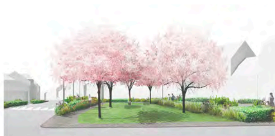
1. VUE SUR JARDIN DEPUIS L'INTERSECTION DES RUES FERNAND SHOENENBERGER ET DES OULCHES