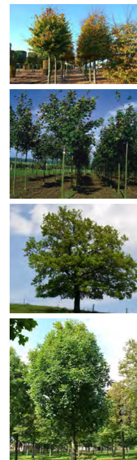
Palette végétale - Voie de 15m